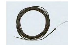
Sinktipp mit Tungstenaustausch zur Beschwerung (Fliegenfischen)