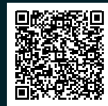
PDF des Flyers

Nicht nur Blei ist für Lebewesen in Gewässern problematisch. Auch Kunststoffe wie Gummi, Angelschnüre und andere synthetische Materialien können schädliche Wirkungen auf Wasserlebewesen haben, sei es durch Freisetzung problematischer Stoffe oder infolge ihrer Aufnahme mit der Nahrung. Deshalb ist auch darauf zu achten, dass diese Materialien nicht in die Umwelt gelangen. Die Natur dankt's!