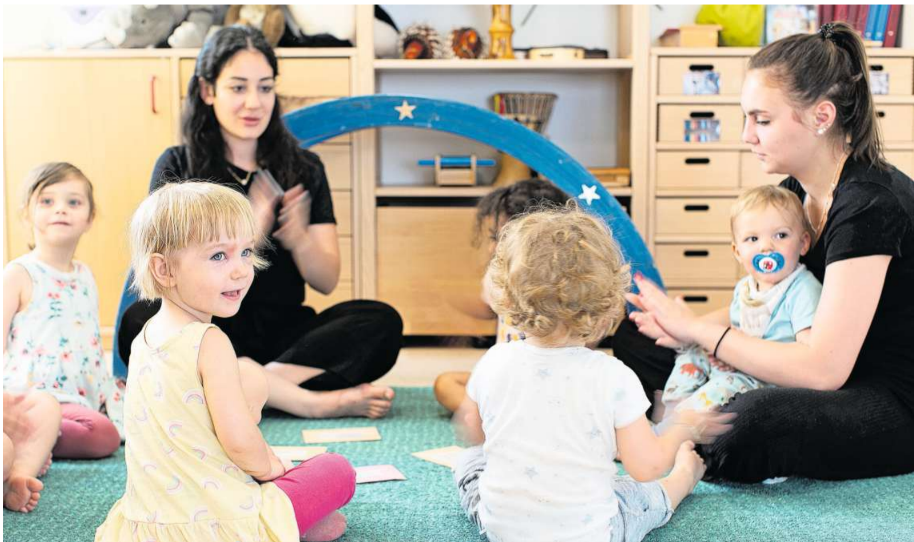
In elf Ausserrhoder Gemeinden gibt es Kindertagesstätten.

Die neue Leistungsvereinbarung ist unbefristet. Inhaltlich ergeben sich mit ihr im Vergleich zur bisherigen Vereinbarung kaum Änderungen. Die Abgeltung des Kantons bleibt gemäss Mitteilung unverändert bei 80 000 Franken pro Jahr. (rk)